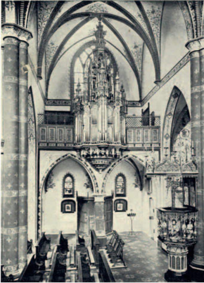
Het orgel rond het begin van de 19 e eeuw.