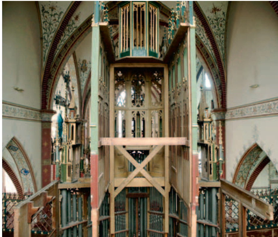
Een unieke blik van achter op de opengewerkte kast vóór de reconstructie van de pedaalkast.