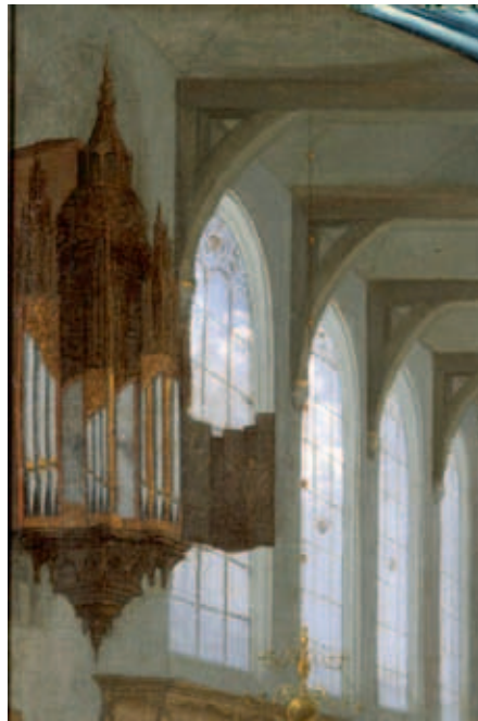
Deel van het schilderij uit 1658, toegeschreven aan H.J. van Baden.

Volgens Joachim Hess (zie bronnen) had het orgel rond 1774 vier balgen, alsmede 17 registers, verdeeld over bovenwerk, hoofdwerk en aangehangen pedaal. Op het "Onder-Clavier: Praestant 8 vt, Holpyp 8 vt, Octaav 4 vt, Super Oct. 2 vt, Quint 1 1/2 vt, Mixtuur, Cornet en Trompet 8 vt", op het "Boven-Clavier: Bourdon 16 vt, Quintadeena 8 vt, Octaav 4 vt, Gemshoorn 2 vt, Woutfluit 2 vt, Quintfluit 3 vt, Tertiaan en Sexquialtra" en op het "Pedaal: Trompet 8 vt". Hij vermeldt tevens "Dit werkje is zeer sterk en doordringend van geluid, deszelfs uiterlyk aanzien geeft genoegzaam te kennen dat den eersten aanleg van 't zelve zeer oud moet zyn." Volgens Den Hertog (zie bronnen) werd de klank in die tijd zeer gewaardeerd en beschreven als "saft" en "soet" alsmede "krachtig en toch lieflijk". De bekendste orga-