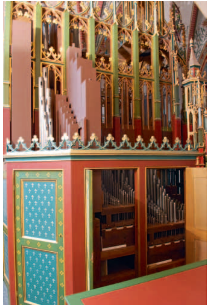
De achterzijde van het orgel.