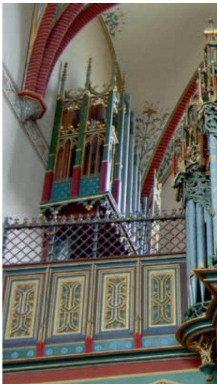
Situatie vóór 2009 met de pedaallade van 1967 links van de orgelkast.