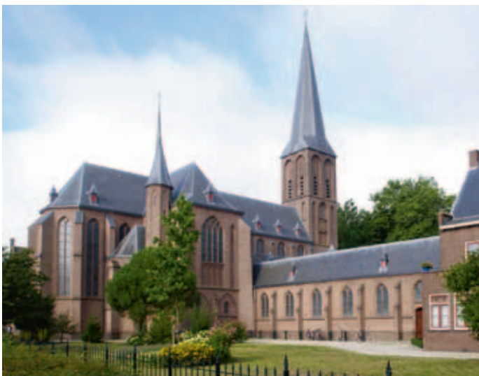
De St.-Nicolaaskerk vanuit het noorden gezien.