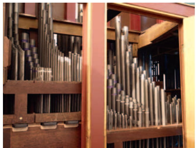
Het pijpwerk aan de C-zijde met rechts manuaal I, links manuaal II en vooraan het chromatische hoogste octaaf. Duidelijk zichtbaar zijn de pijpverlengingen.