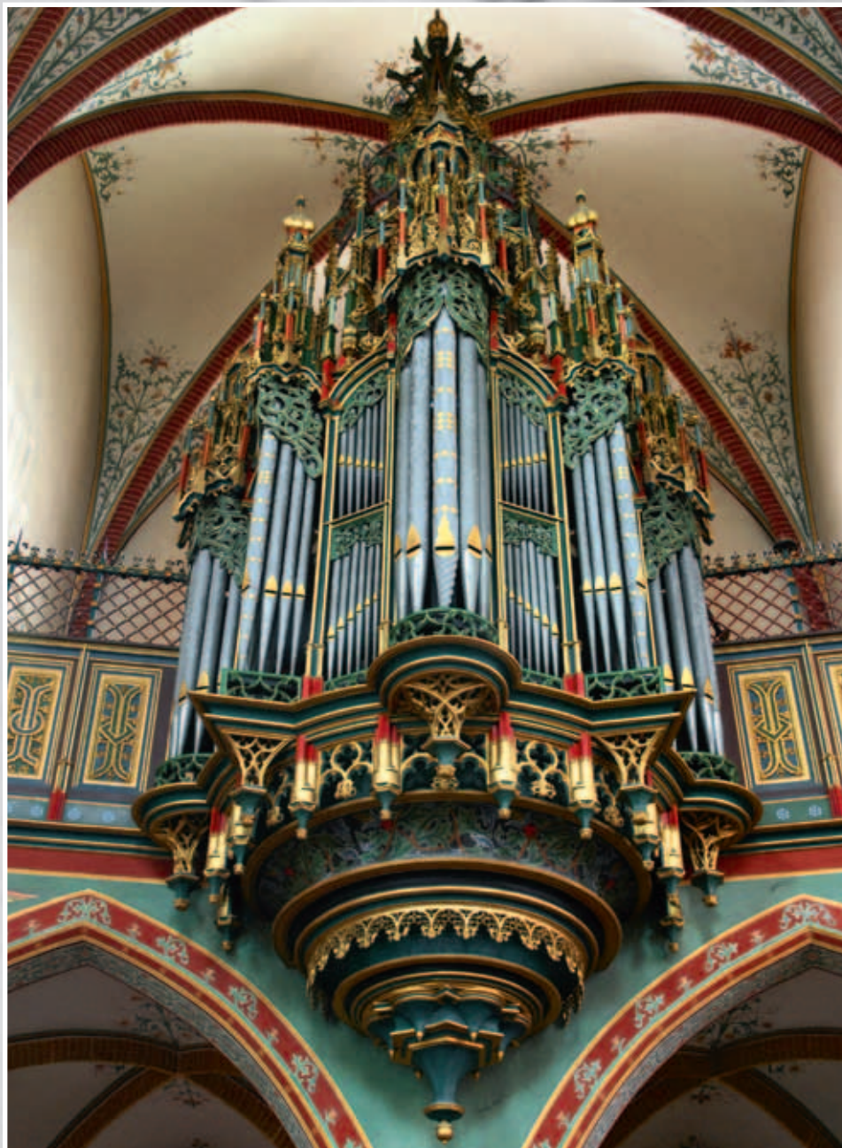
Nieuwegein-Jutphaas, R.-k. Sint-Nicolaaskerk

Jaargang 53 nr. 1/2 - januari/februari 2011