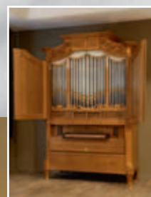
Kabinetorgel in Kamerik