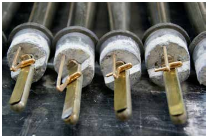
Pijpen van de pedaal-Trombone 8 vt voor de restauratie met aangetaste koppen en krukken van verschillende factuur.