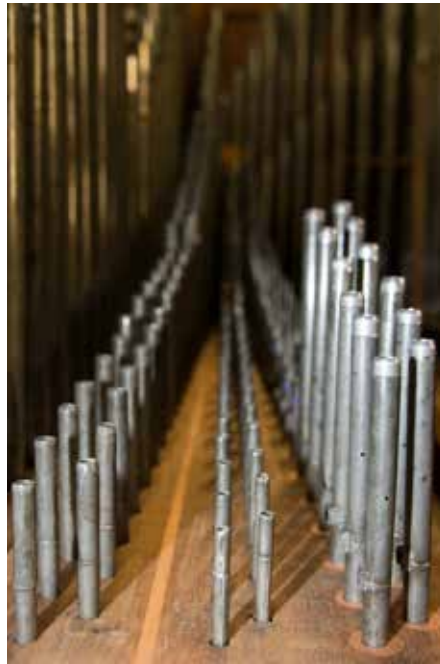
De voorste hoofdwerkklade met v.l.n.r. de Octaaf 4 vt, de Octaaf 2 vt, en het bovenste octaaf van de Roerfluit 8 vt met overblaasgaatjes en verlengde pijpen.

in bijvoorbeeld Oosterhout, Sneek, Delft en Zwolle. Zowel de grondstemmen als de soloregistraties zijn, zoals we van Michaël Maarschalkerweerd gewend zijn: warm, poëtisch, karakteristiek en duidelijk. De verschillende stemmen laten zich bijna eindeloos combineren en mengen naadloos tot een nieuwe klank. Vermeldenswaard zijn de wijdgemensureerde dragende prestanten op het hoofdwerk, de bijzondere Franse overblazende fluiten, de fijne Quintadeen, de penetrante Viola di Gamba, de intieme Fernfluit en de lyrische doorslaande, in eigen huis vervaardigde Klarinet, een unicum in het overgeleverde bestand van Maarschalkerweerd-orgels. De Mixtuur is krachtig en enigszins klassiek van karakter.