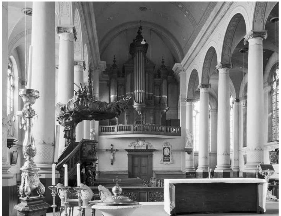
Het kerkinterieur met de Rooms Katholieke liturgische inrichting en de oorspronkelijke banken in oktober 1967.

In 1822 wordt daarom de eerste steen gelegd voor een nieuw neoclassicistisch kerkgebouw aan de Lange Haven, ontworpen door de architect Adrianus Tollus (1782-1847). De waterstaatskerk wordt twee jaar later in gebruik genomen en in 1825 plaatst Wander Beekes (1795-1838) er een nieuw orgel met twee manualen, aangehangen pedaal en 22 stemmen. Dit voldoet slechts ten dele: wanneer pastoor Vincentius van Ewijk in 1870 het zilveren feest van zijn pastoraat viert, biedt de parochie hem een nieuw orgel aan. Als orgelbouwer wordt Theodorus Vermeulen (1820-1872) verkozen, die echter spoedig komt te overlijden. Vervolgens gaat de opdracht naar de firma Maarschalkerweerd & Zoon, welke in 1872 bekendheid had gekregen door een nieuw orgel van 26 stemmen met twee manualen en vrij pedaal in de St.-Dominicuskerk te Utrecht. De Havenkerk krijgt een zuster-orgel met een iets grotere dispositie van 29 registers. Beide instrumenten hebben nog geen crescendo- of echokast. Friedrich Wilhelm Mengelberg (1837-1919) tekent de rijzige kast, die vervolgens door de lokale timmerlieden Wouterlood en Berkelaer wordt vervaardigd. Michaël Maarschalkerweerd (1838-1915) brengt het Beekes-orgel over naar de St.-Josephkerk in Den