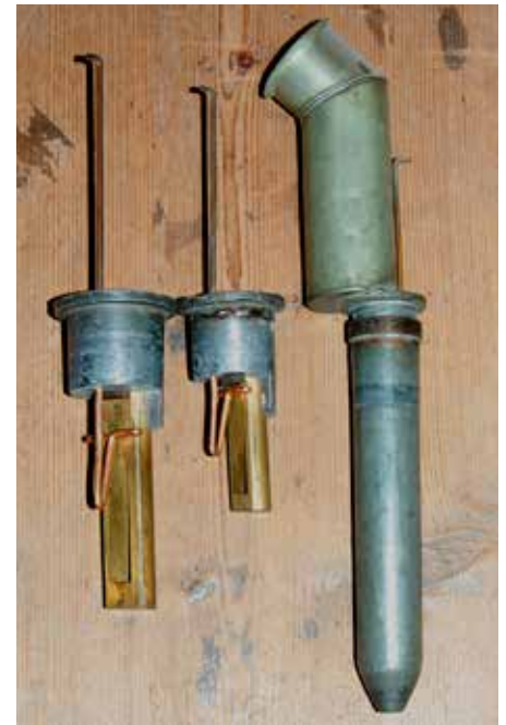
Drie pijpen van de doorslaande Klarinet 8 vt met rechts de asymmetrische geplaatste beker met 'elleboog' knik.

Het programma van de Orgeldag toonde aan dat muziek uit verschillende