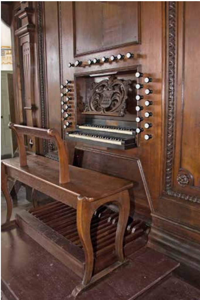
De fraai gerestaureerde speeltafel met het later aangebrachte pedaalklavier tot e 1 (!) en dito snijwerk op de lessenaar.