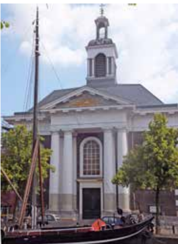
De St.-Johannes de Doperkerk of Havenkerk in Schiedam.