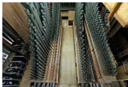
Beide chromatische hoofdwerkkladen na de restauratie; links de gereconstrueerde conducten naar de frontpijpen en de speeltractuur naar het bovenwerk, rechts de Prestant 16 vt van het pedaal