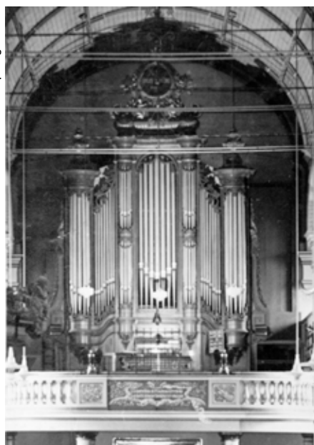
Het zusterorgel uit 1872 in de St.-Dominicuskerk te Utrecht.

en de kapellen van de zusters Dominicanessen in Voorschoten (1887, zusterscongregatie van de H. Catharina van Siena), Schiedam (1888, Vincentiusklooster), Rotterdam (1901) en Nijmegen (1912).