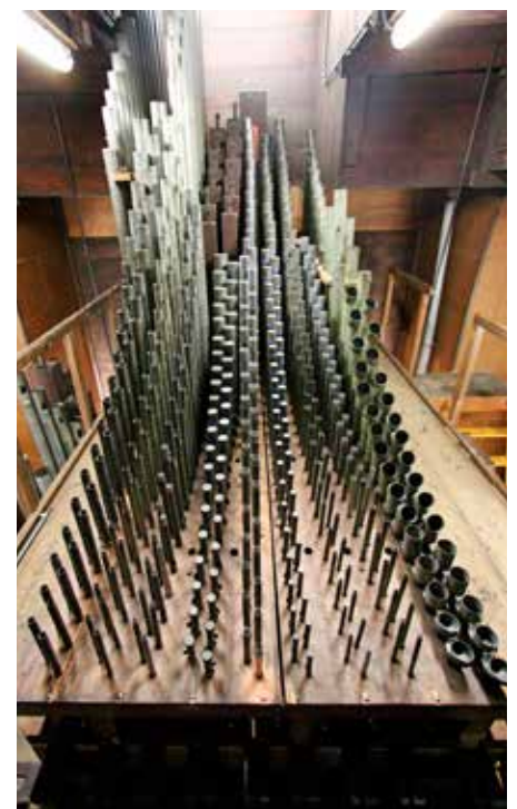
De dwarsgeplaatste chromatische positieflade na de restauratie, met links op de achtergrond enkele baspijpen van de achterste hoofdwerkklade