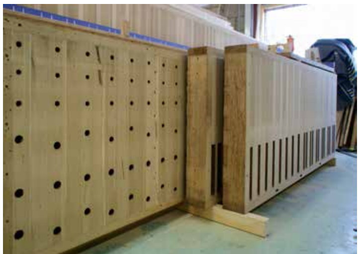
Vooraan de geresatureerde pedaalwindladen met deels dubbele ventielopeningen, de voorste hoofdwerkklade en, op de achterzijde gezien, de bovenwerkklade bij Pels & Van Leeuwen.